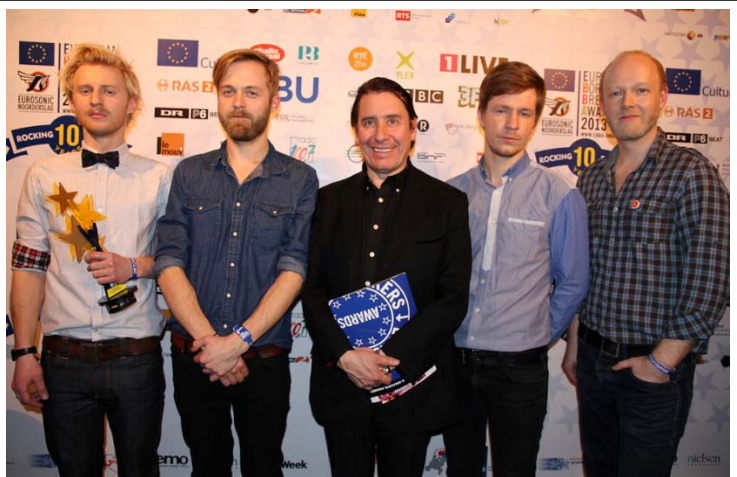
Ewert and the Two Dragons accepted the European Border Breakers Award (EBBA) at the EBBA's 10 th anniversary gala in Groningen, Netherlands, on January 9, 2013.

The EBBA Awards were handed out by the European Commission at the European Border Breakers Award's 10 th anniversary gala in Groningen on Jan. 9, 2013, to artists, who have proven to be successful in crossing borders with their first international release in Europe. The award gala was hosted by TV personality and musician Jools Holland at a televised ceremony, recorded and broadcast by Dutch National Television (NTR) and was covered through TV channels and radio stations across Europe. Estonian Public Broadcasting (ETV) will air the show on February 9, right after the evening news.