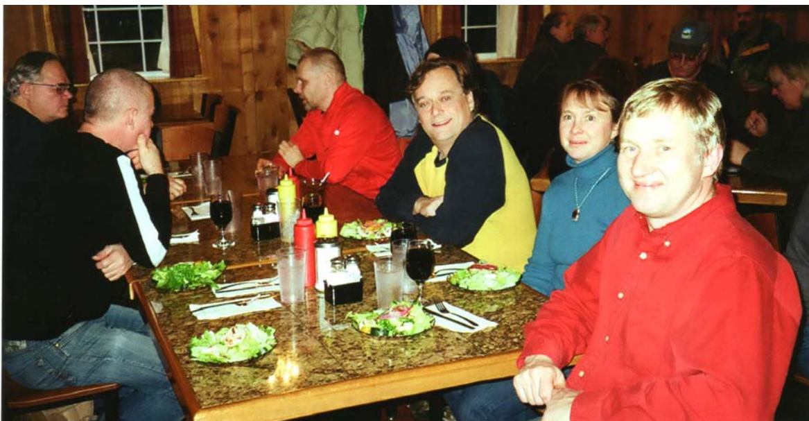
Laupäevasel õhtusöögil Huckleberry Inn restoranis nauditakse toidu kõrval ka lõbusat koosolekut