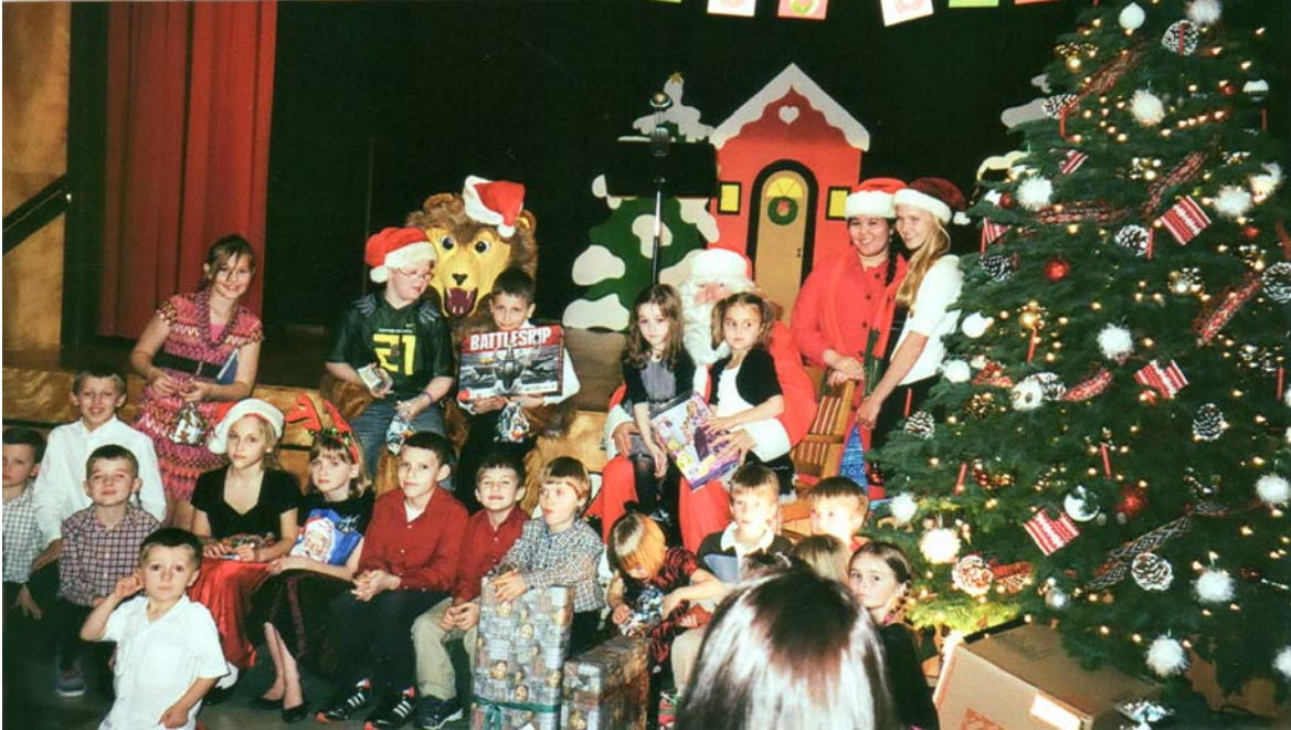
Arukas lastehulk on kogunenud jõuluvana juurde, et olla valmis kinkide saamiseks.