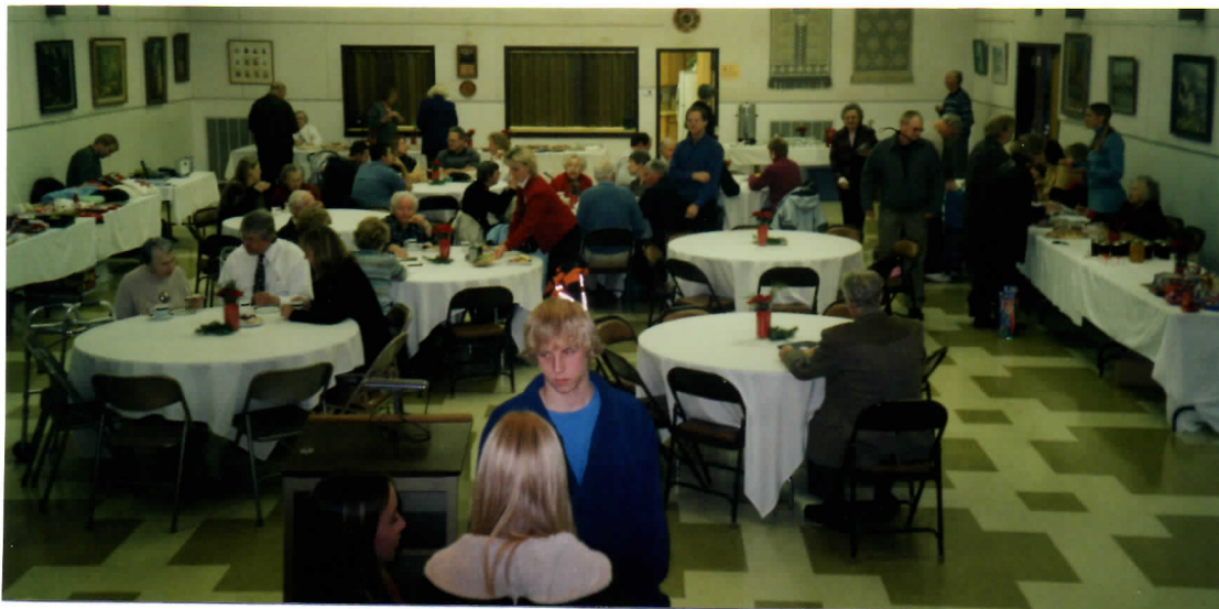
Inimesed on koanemas Koguduse jõululaadale / loteriile pühapäeval 27. nov. 2005