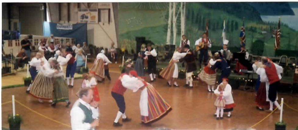
Portlandi rahvatantsurühm "Tulehoidjad" lõbustavad pealtvaatajaid eesti rahvatantsude esitamisega jaanipäeval, 17 juunil skandinaavlaste "Midsummer Festival'il" Astorias (Clatsop Cty. Fairground).

Eelseisvail suvekuudel saavad rahvatantsijad veidi hinge tõmmata ja jõudu koguda sügisel algavale tegevusperioodile. Teadaolevalt seisab nii mõnelgi ees suvine küllasõit Kodu-Eestisse. Head reisu!