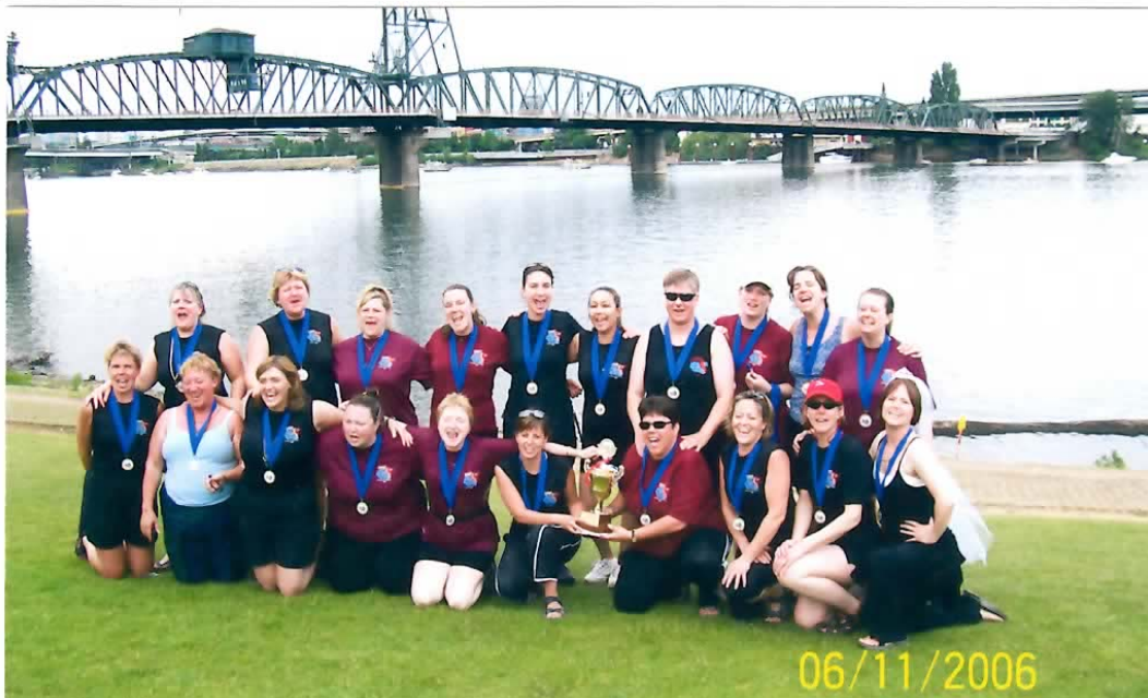
Picture of the 20 member Tsunami Sisters team, who won the first place on the Dragon Boat Race during the Portland Rose Festival in 2006.

People born in the Year of the Dog possess the best traits of human nature. They have a deep sense of loyalty, are honest, and inspire other people's confidence because they know how to keep secrets. But Dog People are somewhat selfish, terribly stubborn, and eccentric. They care little for wealth, yet somehow always seem to have money. They can find fault with many things and are noted for their sharp tongues. They can be cold emotionally. Dog People make good leaders.