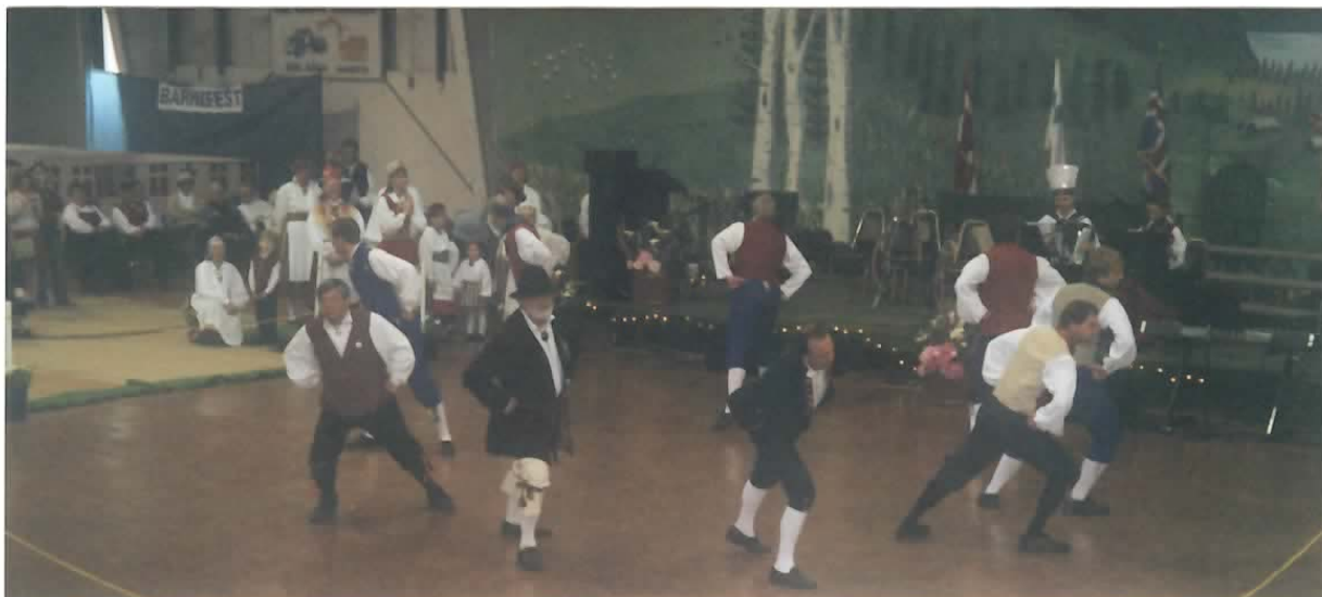
Tõsisema meeste rahvatantsuga esines Portlandi rahvatantsurühma "Tulehoidjad" mehed esinemisel skandinaavlaste "Midsummer Festival'il" Astorias 17. juunil 2006.