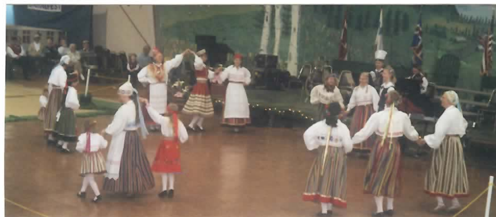
Portlandi naisrahvatantsijad koos lastega esitavad lõbusalt hoogsa eesti rahvatantsu skandinaavlaste "Midsummer Festival'il" 17. juunil Astorias (Clatsop Cty. Fairground).