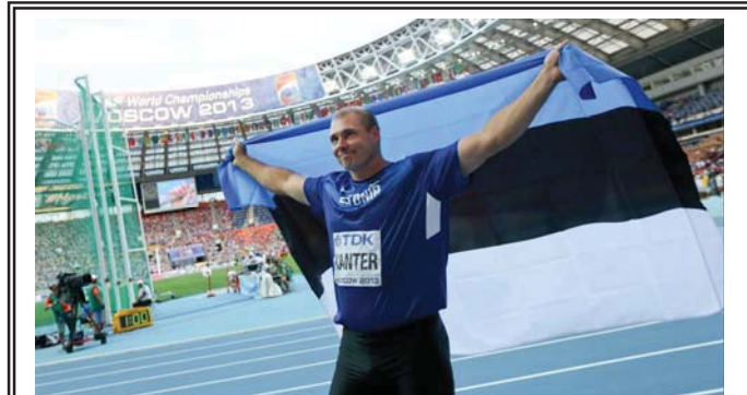
Gerd Kanter tähistamas Eesti lipuga pronksmedali saavutamist.

Kanter tunnistas pärast võistlust, et ta ei leidnud õiget rütmi. Kanter lisas, et hiljutine seljavigastus teda ei seganud ja vorm on tegelikult korralik. (PM/EE)