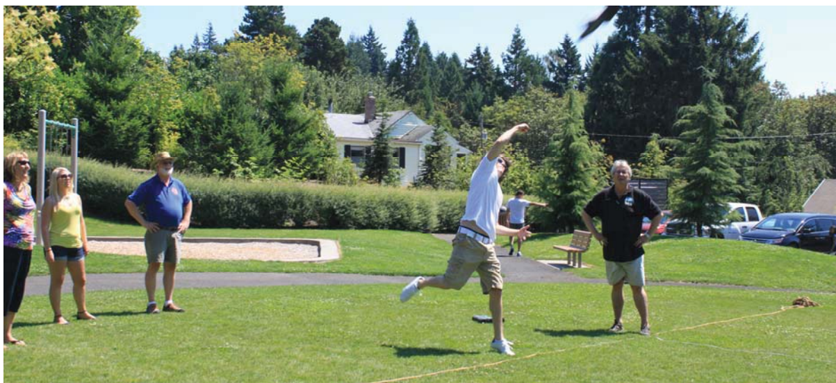
Suvepäeval viidi meelelahutuseks läbi mitmesuuseid võistlusi. Pildil kummisaapa viskamise võistlus.