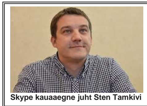
Skype kauaaegne juht Sten Tamkivi

lähenevat 10. juubelit ühtlasi ka tema matuseks. Sest kõik otsused tehakse USAs Seattle'i lähistel Redmondis, Microsofti peakontoris. (ÄP/EE)