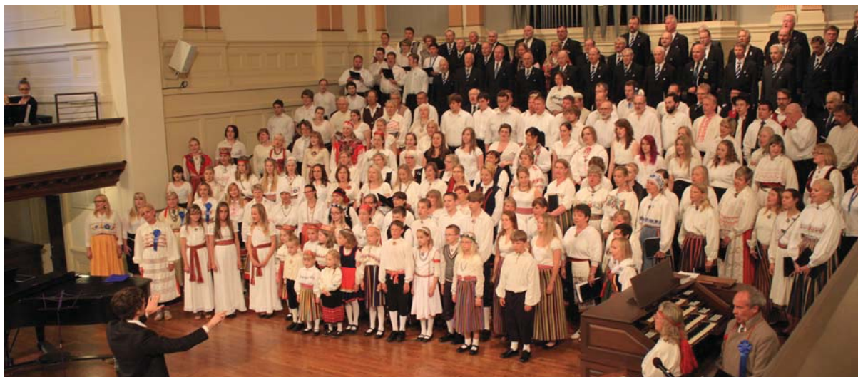
Ühendkoor esinemas Lääneranniku Eesti Päevadel San Franciscos laupäeval, 29. juunil 2013