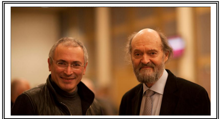
Mihhail Hodorkovski ja Arvo Pärt.

Eesti kuulsaim ja maailmas enimmärgitud elav helilooja Arvo Pärt kohtus märtsi alguses esimest korda Mihhail Hodorkovskiga, kellele ta 2008. a. pühendas oma sümfoonia "Los Angeles".