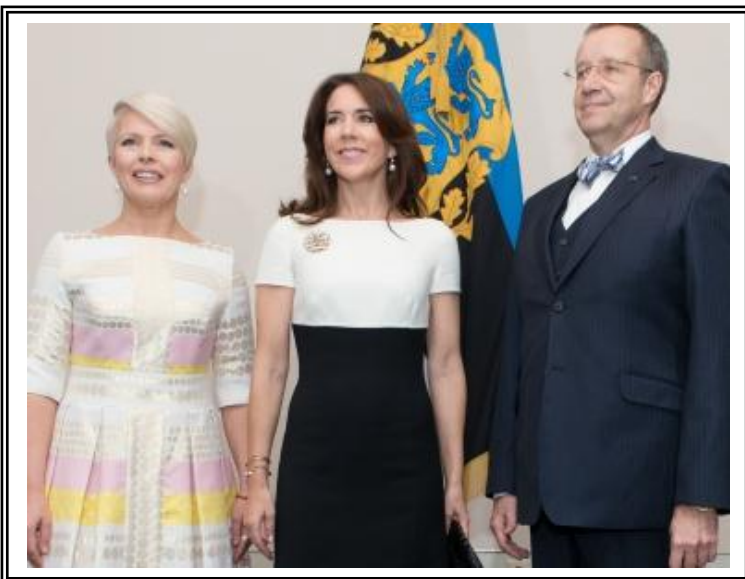
Pildil Evelin Ilves, Taani Kroonprintsess Mary ja Eesti president Toomas Hendrik Ilves.